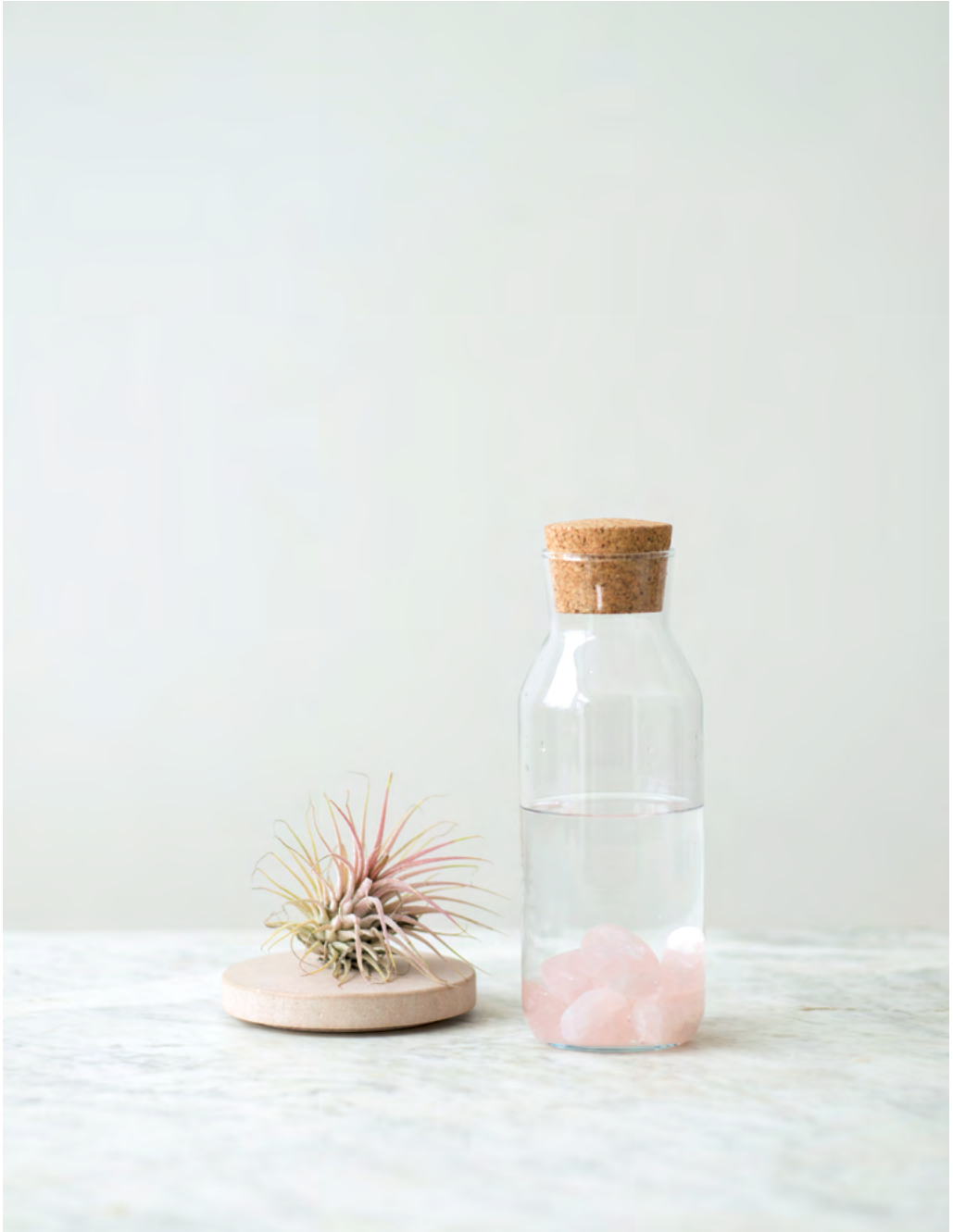
Eau de quartz rose (recette p. 45).